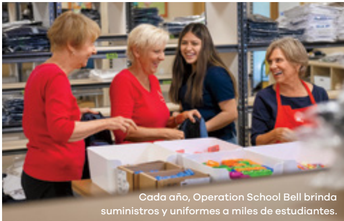
Cada año, Operation School Bell brinda suministros y uniformes a miles de estudiantes.