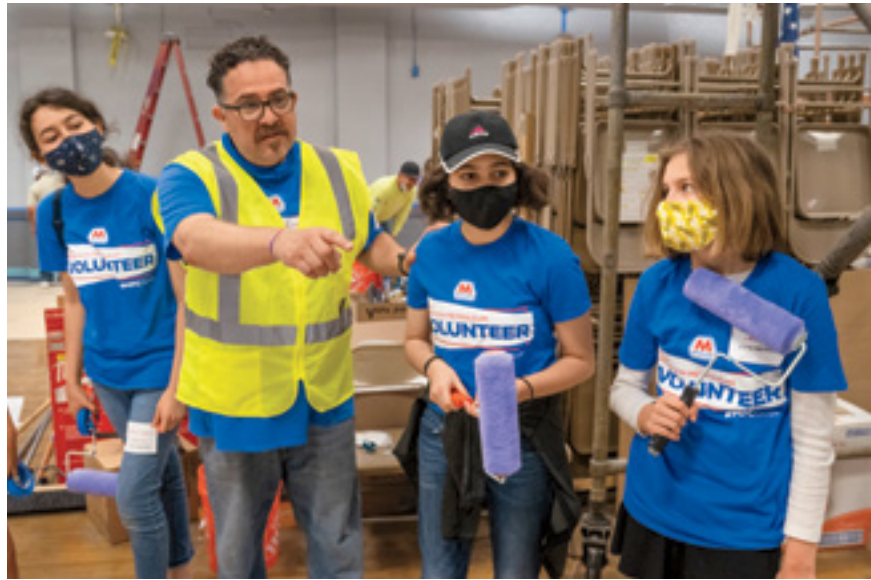
Más de 100 empleados y contratistas de Marathon se unieron para revitalizar a Wilmington Park Elementary School.