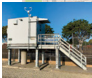
Arriba: El nuevo sistema de monitoreo del aire de Carson y Wilmington. Izquierda: La estación de ruta de monitoreo C12, visible en S. Wilmington Ave. y E. 223rd Street en Carson.